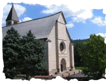
Basilica dei Santi Martiri Sanzeno (TN)