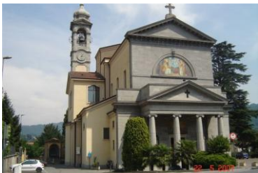
Chiesa Prepositurale di Brivio

Signore, mio Dio, in te mi rifugio: tu, pane dei santi, nutrirmi vorrai. Con te, mio pastore, mi sento sicuro: tu, dono del Padre, a lui mi conduci.